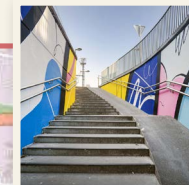
© Jules Cesure Nivelles - Sud II